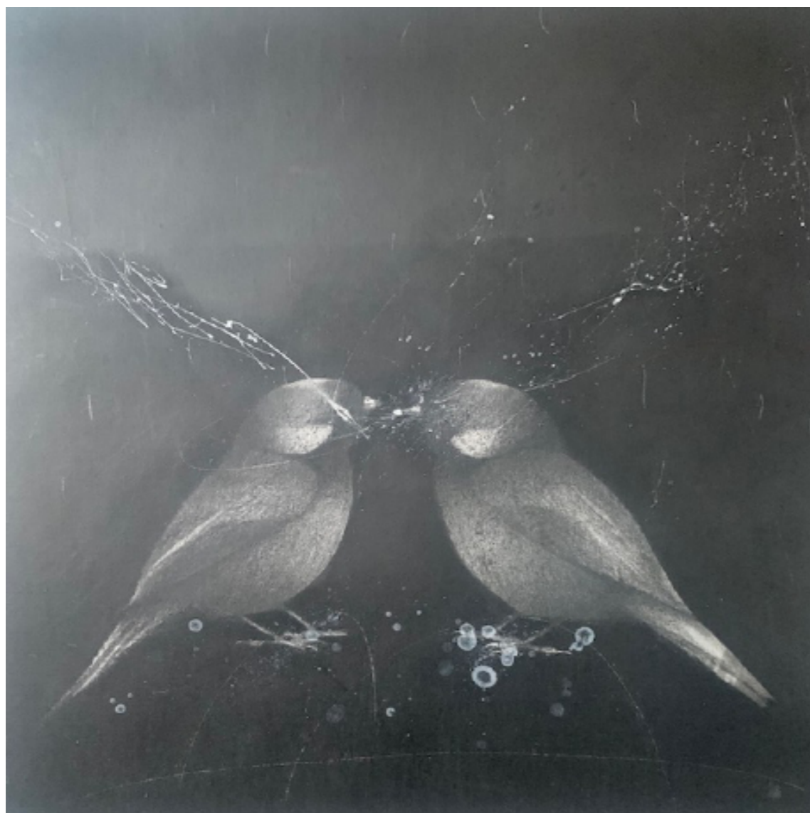
Duo symphonique - 50 x 50 cm - Mine de plomb & acrylique papier marouflé sur toile - 2024