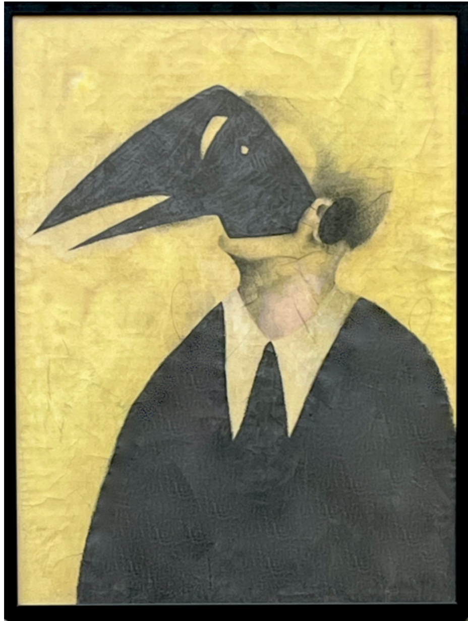
Sous le masque la tête de l'autre I - H80 x 60 cm - Mine de plomb & acrylique papier japonais «washi» à l'écorce de murier - 2021