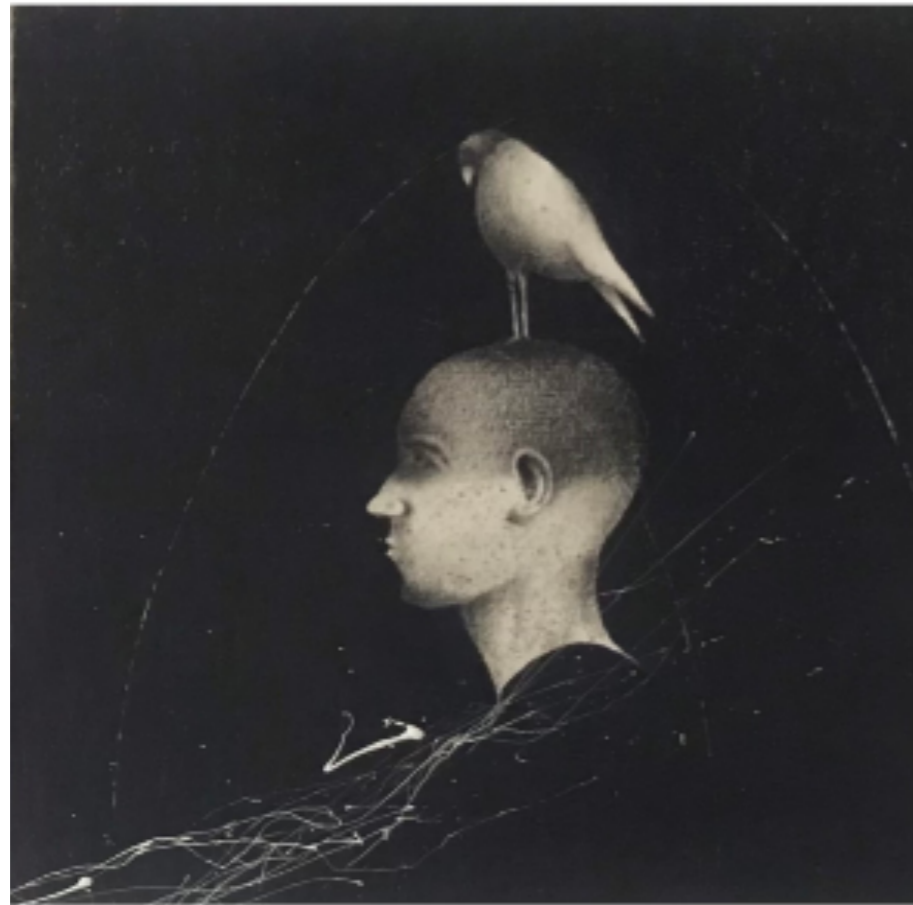
Symphonie I - 20 x 20 cm - Mine de plomb & acrylique papier marouflé sur carton - 2024