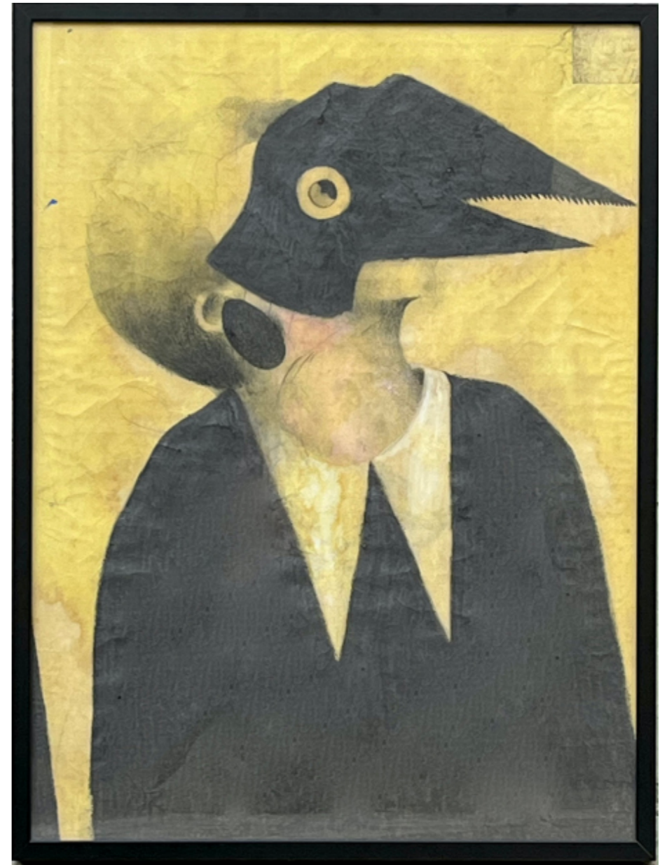
Sous le masque la tête de l'autre II - H80 x 60 cm - Mine de plomb & acrylique papier japonais «washi» à l'écorce de murier - 2021