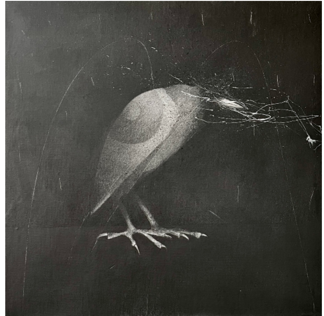
L'observateur I - 50 x 50 cm - Acrylique & mine de plomb - 2024

« POUSSIÈRE D'ÂME ». À travers ce bestiaire à la mine de plomb surhaussé d'acrylique, en jouant sur les émotions contrastées que ces créatures peuvent émaner, passant selon leur représentation de l'obscurité à la liberté, j'ai voulu symboliser la fragilité, la légèreté, la mortalité et la vulnérabilité de la vie humaine, rappelant que chaque âme est un souffle dans l'immensité du temps.