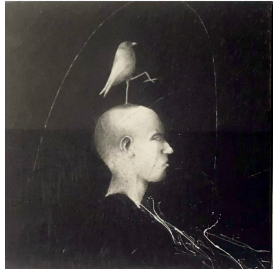
Symphonie II - 20 x 20 cm - Mine de plomb & acrylique papier marouflé sur carton - 2024