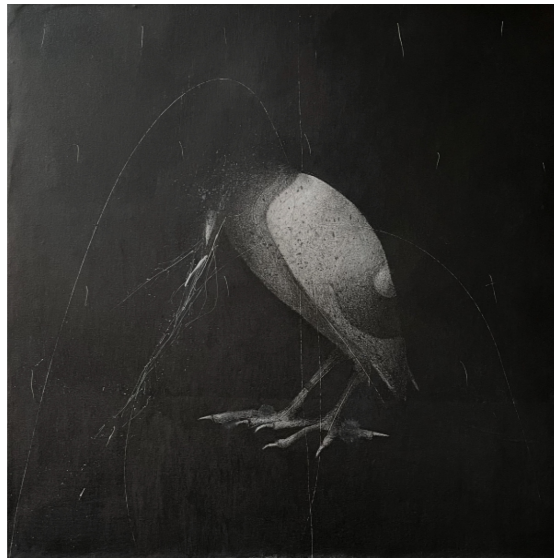
L'observateur II - 50 x 50 cm - Acrylique & mine de plomb - 2024